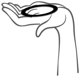
Rycina 1. Wyjąć system Ginoring z saszetki