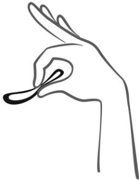
Rycina 2. Ścisnąć system