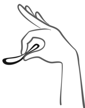
Rycina 2 Ścisnąć system